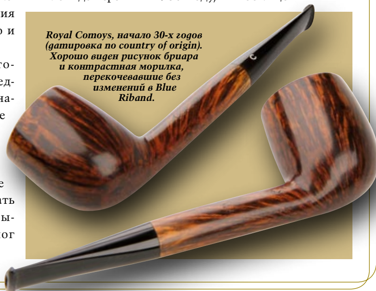
Royal Comoy's, начало 30-х годов (газировка по country of origin). Хорошо виден рисунок бриара и контрастная морилка, перекочевавшие без изменений в Blue Riband.

Один из самых известных грейдов Comoy. Скорее всего, он открыт в 1936 году, и посвящён