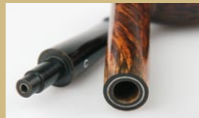
Армированные чубук и цапфа, впервые применённые в 30-х годах. К сожалению, чубук в них и остался, а вот вставка в цапфе вплоть до конца 60-х означала принадлежность трубки к одному из высших грейдов.

Трубки этого грейда предшествовали знаменитому Blue Riband, и стояли в начале 40-х годов $35. Желающие могут высчитать примерный нынешний аналог этой цены.