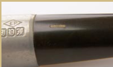
Первоначальный логотип Grand Slam на мундштуке