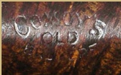
Неизменное написание грэйда Old Bruyere.

А вот это уже – полноценный грэйд, на несколько лет ставший флагманским для фабрики. Введён он, скорее всего, в 1921 году. Интересно, что трубки в этом грэйде поначалу имели как straight grain, так и cross cut рисунок.