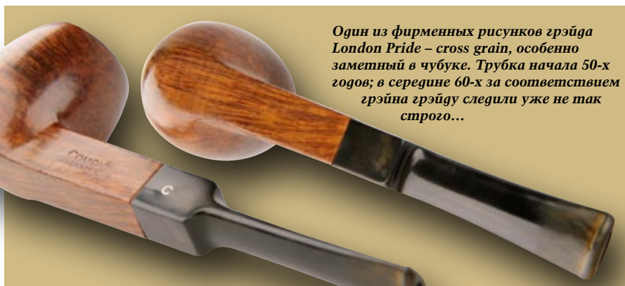
Один из фирменных рисунков грэйда London Pride – cross grain, особенно заметный в чубуке. Трубка начала 50-х годов; в середине 60-х за соответствием грэйна грэйду следили уже не так строго...

Грэйд, стартовавший в начале 40-х, и предназначенный для того, чтобы частично отобрать потребительский спрос у Blue Riband. В отличие от «ленты», «прайд» имел натуральный светлый финиш, и не вертикальный