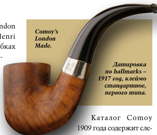
Comoy's London Made.

Собственно, это ещё не грэйд. Это два брэнда, разведенных в две линейки. Существовавшие параллельно около 20 лет. Почему я решил, что это – уже грэйды?