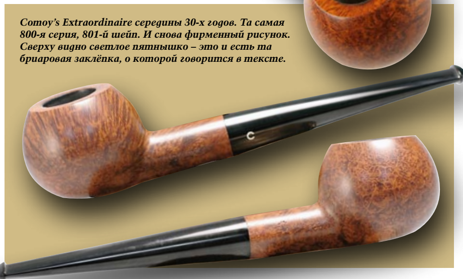
Comoy's Extraordinaire середины 30-х годов. Та самая 800-я серия, 801-й шейп. И снова фирменный рисунок. Сверху видно светлое пятнышко – это и есть та бриаровая заклёпка, о которой говорится в тексте.