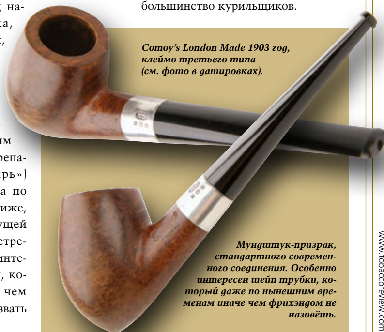
Comoy's London Made 1903 год, клеймо третьего типа (см. фото в датировках).

Comoy's London Made просуществовала как линейка тоже до начала Первой мировой, но её судьба оказалась иной – она стала общим брэндом. Во всяком случае, уже в 1917 году все трубки маркировались именно как Comoy's, а с начала 20-х «London Made» переехала на правую сторону чубука, где и поселилась на постоянной основе. Слева остался только один штамп, содержащий имя Comoy's и, немного погодя – название грэйда. Это именно та оштамповка, к которой привыкло большинство курильщиков.