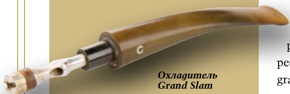
Охладитель Grand Slam крупным планом.

которой безошибочно определяется не только грейд трубки, но и примерная дата выпуска. После войны Grand Slam стали выпускать со стандартной «С».