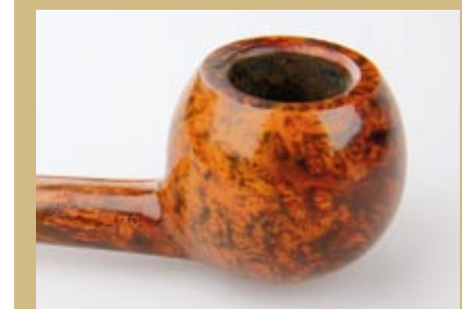
Comoys's Grand Slam конца 40-х годов. Тот самый, фирменный рисунок бриара: «пламя» с одной стороны чаши и «птичий глаз» – с другой.