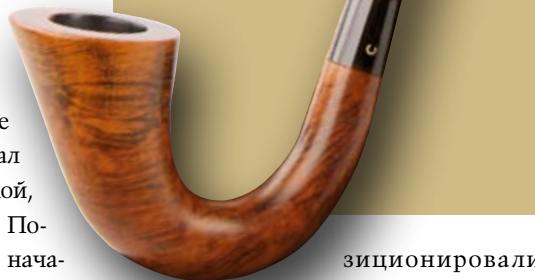
Comoys Tradition юбилейной серию 1925 года.