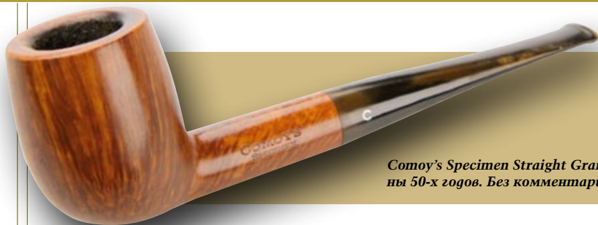
Comoy's Specimen Straight Grain серегуны 50-х годов. Без комментариев.

в одну – Specimen Unique. Трубки этой серии – настоящие раритеты, их было выпущено всего несколько десятков под обеими марками, но в разных формах.